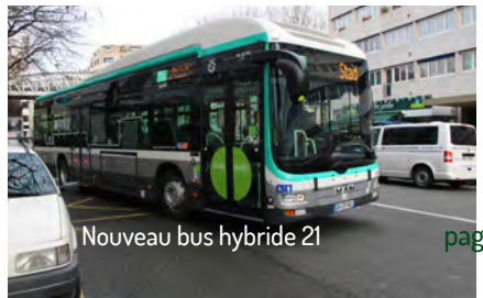
Nouveau bus hybride 21

Pour mieux partager l'espace public , nous réaménagerons la Place d'Italie et ses abords au profit des piétons et des riverains, requalifierons le boulevard Blanqui et le Boulevard Saint-Marcel, afin qu'ils soient pacifiés et sécurisés. Enfin, nous étudierons la suppression des « dalles » des grands ensembles pour retrouver le niveau des rues et diminuer les charges pour leurs habitants.