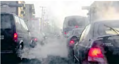
Supprimer les véhicules diesel

« bio » dans toute la restauration collective municipale. Nous lutterons contre le gaspillage alimentaire en mettant en place une éducation nutritionnelle dès l'école, en soutenant les AMAP et en créant un « panier » d'alimentation, viande et fruits et légumes « bio », distribué aux personnes à faibles ressources. Nous soutiendrons l'ouverture d'un Centre conventionné de médecine chinoise et de médecines alternatives.