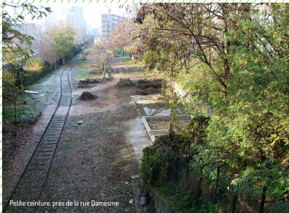
Petite ceinture, près de la rue Damesme