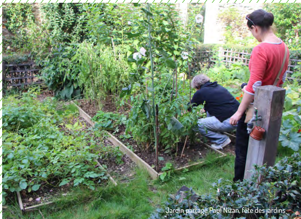
Jardin partagé Paul Nizan, fête des jardins