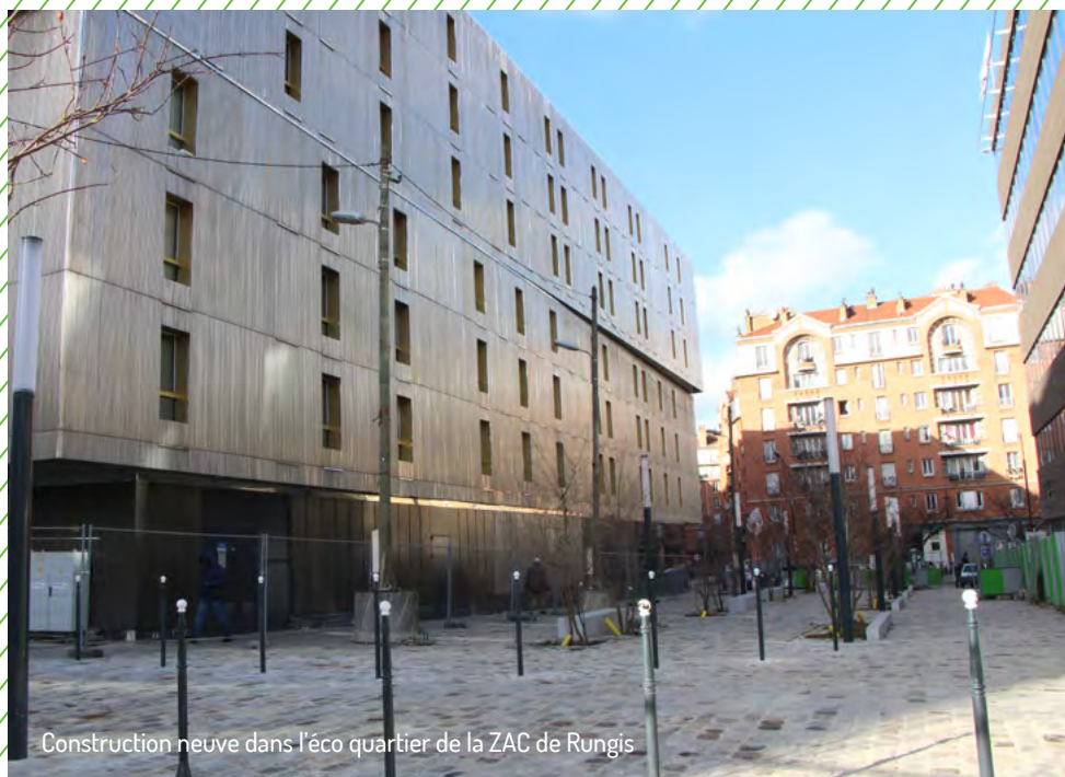
Construction neuve dans l'éco quartier de la ZAC de Rungis