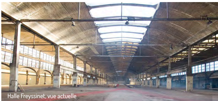
Halle Freyssinet, vue actuelle

Notre projet écologiste veut réconcilier dynamisme économique, prospérité durable et sociale pour créer des emplois et conforter le rayonnement de l'arrondissement. Nous voulons engager la transformation écologique de l'économie en s'appuyant sur les initiatives locales existantes (les Recycleries). Nous voulons favoriser l'économie circulaire et collaborative, le réemploi, les systèmes d'échange locaux, le partage numérique, le « coworking » et l'émergence de « tiers lieux ». Nous proposons le développement de l'emploi local dans les filières écologiques préventives, notamment la rénovation thermique des bâtiments.